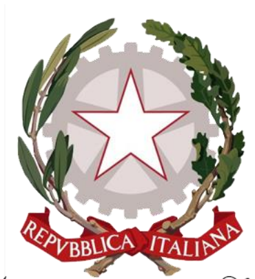
Ministero della Salute